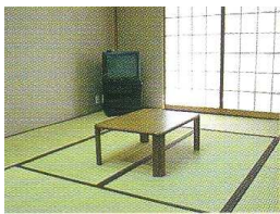
本館 和室 10畳 定員5名