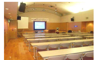
大ホール1室 最大150名 225㎡