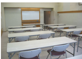
研修室3室 30名 44.5㎡