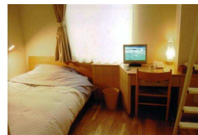
新館 洋室 ロケ太ツイン 定員2名