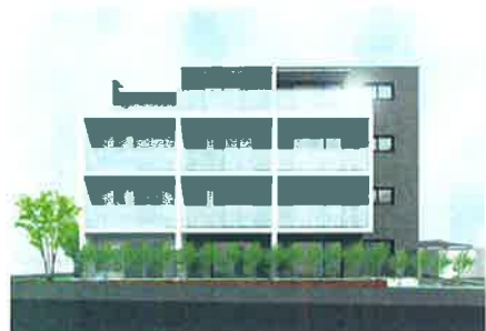
完成イメージ図：図面を基に描き起こしたもので実際とは異なります