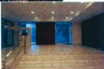
間取図が現況と異なる場合は現況優先とさせていただきます。

東京メトロ日比谷線 恵比寿駅 徒歩2分 山手線 恵比寿駅 徒歩4分 東横線 代官山駅 徒歩7分