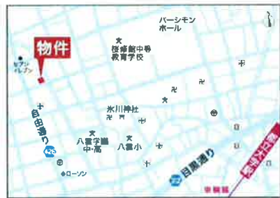
カスターリア八雲