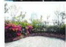
【801のルーファガーデン】