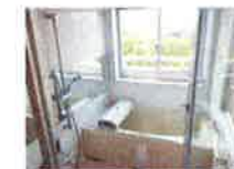
【感のあるバスルーム】