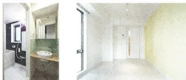
洗面・トイレもそれぞれのアクセントカラー