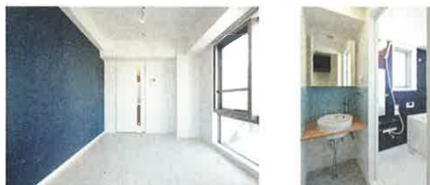
お部屋ごとに異なるアクセントクロス