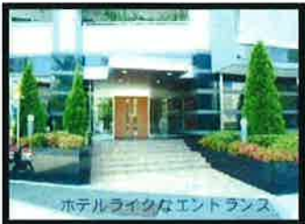
ホテルライクなエントランス